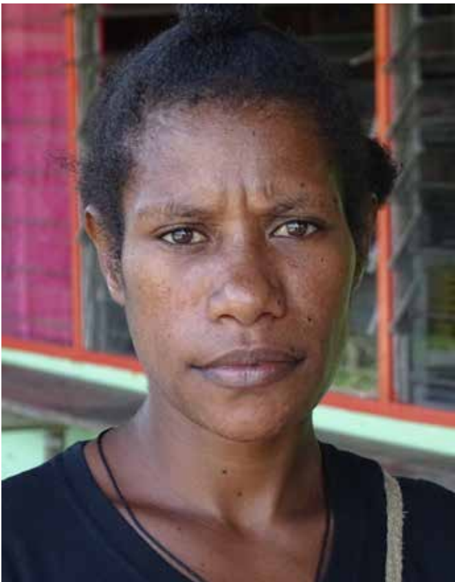
Een jongvolwassene uit de gemeente in Kouh; ze heeft net de vrouwenvereniging bijgewoond

Laten we insteken op de persoonlijke omgang met elkaar. Binnen de eigen gemeente, maar juist ook richting zusterkerken in het buitenland. Door er voor elkaar te zijn, elkaar onze problemen voor te leggen, naar elkaar te luisteren, elkaar te bevragen en zo samen te groeien in volwassenheid. Ouders, die kinderen opvoeden tot jongvolwassenen, kijken in de spiegel. Hetzelfde doet een kerk die elders een gemeente sticht en ondersteunt naar volwassenheid. Dan groeit vanzelf de ouder-