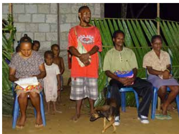
Met een huisdienst en maaltijd wordt in een van de wijken van de gemeente in Kouh feest gevierd: drie jongeren zijn geslaagd voor het eindexamen voortgezet onderwijs (ze kijken niet zo vrolijk).