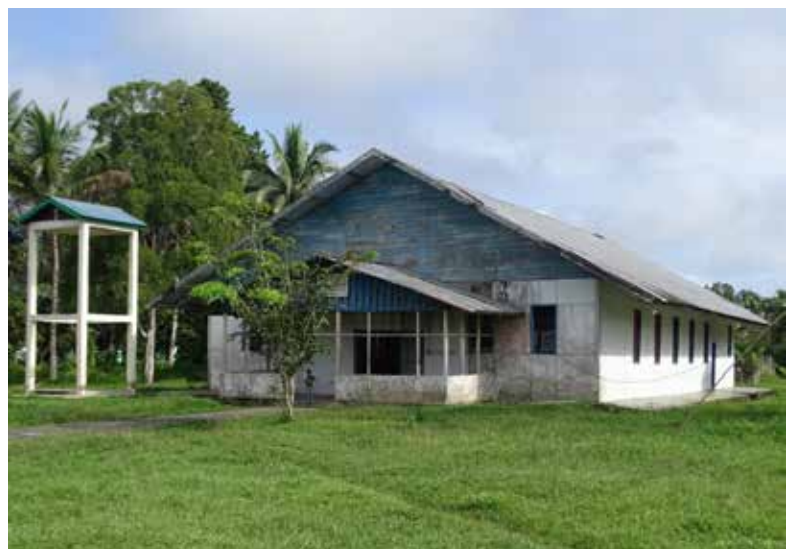
Het kerkgebouw van de gemeente in Kouh

1 Elk jaar maak ik voor LITINDO een werkreis naar Indonesië. In ruim 25 jaar zijn er zo'n 50 boeken uitgegeven op het gebied van gemeentetoerusting en theologie. Lesmateriaal van toen is omgezet in studieboeken. De reizen kris kras door Indonesië dienen ervoor om die boeken te presenteren en om nieuw materiaal te testen. Zo eens in de drie jaar kom ik weer terug in het gebied waar ik eerder heb mogen meehelpen aan de stichting en opbouw van wat nu zelfstandige zusterkerken zijn, de Gereja-Gereja Reformasi di Indonesia (GGRI; Gereformeerde Kerken in Indonesië), regio Papoea.