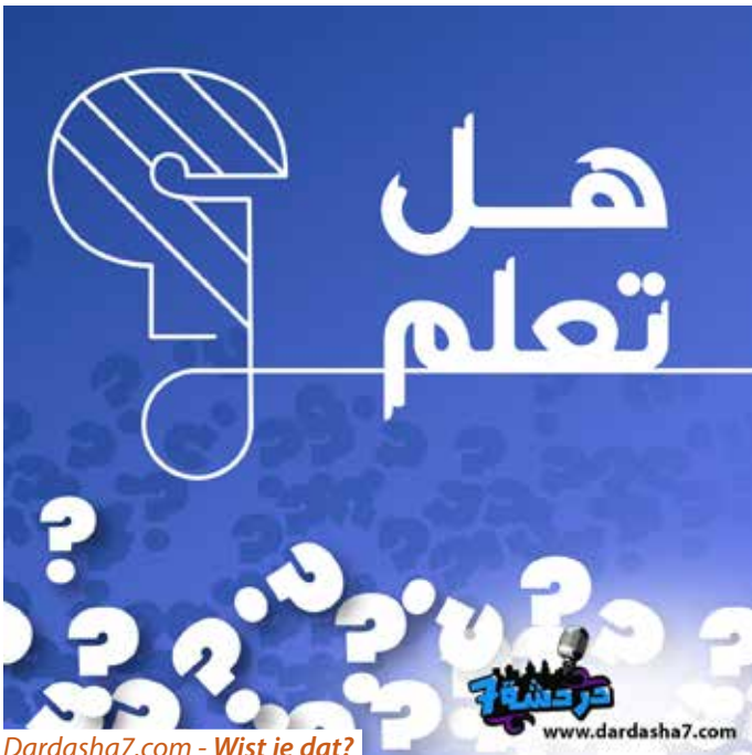
Dardasha7.com - Wist je dat?

Dardasha7.com presenteert het evangelie op een meer indirecte manier. Het arabische 'dardasha' betekent 'informeel kletsen', 'een gesprek'. De website Dardasha7 heeft radio programma's, artikelen en ander materiaal over uiteenlopende onderwerpen. Het behandelt op interactieve wijze verschillende aspecten uit het leven van mensen, als middel om het evangelie te