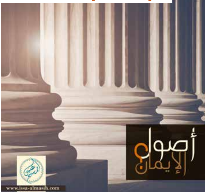
Issa-alMasih.com - Grondbeginselen van het geloof

site bevat audio opnames van evangelische berichten, die speciaal voor moslims zijn gemaakt. Het bevat ook audio opnames van Bijbelse passages die zich richten op de dringende behoefte van de zondige mens aan Gods reddende werk in Christus. Ook nodigt het websitebezoekers uit tot interactie.