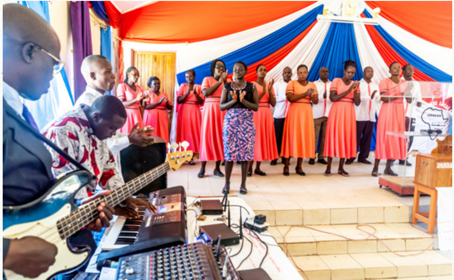
RCEA-gemeente in Kiplombe

Deze gereformeerde kerk in Kenia is een actieve kerk die blijft groeien. Speciale aandacht gaat in 2024 uit naar verdere uitbreiding van de eigen school (RITT) met beroepsopleidingen (technische vakopleidingen). Het gaat om praktijklokalen voor (landbouw-)techniek en elektrotechniek en de uitbreiding van het internaat. Ook ontwikkelen ze het boerderij-gedeelte verder. Dat zorgt ook voor inkomsten.