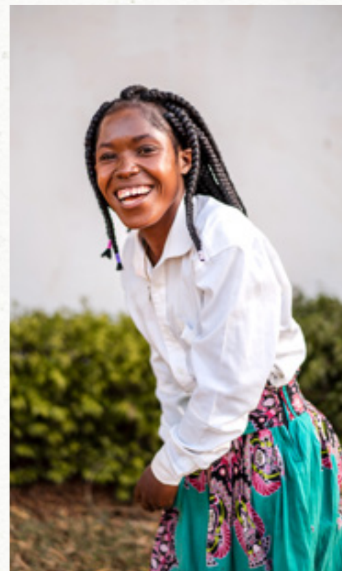
Studente RITT, Eldoret

optrekken in Gods Koninkrijk en elkaar inspireren, steunen en bemoedigen om het geloof te delen, in woorden en daden. Die inspirerende verhalen en bemoedigende getuigenissen uit de wereldkerk hopen we via ons bestuur terug te brengen in onze gemeente.