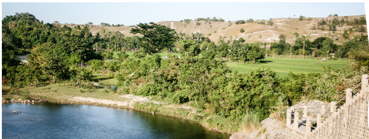
Landbouw op Soemba

stieren uit aan boeren, als een soort krediet. Dit stiertje wordt door het boerengezin grootgebracht. Na een paar jaar wordt het dier verkocht voor de slacht. Van het geld dat de boeren krijgen voor een volwassen stier, gaat een deel naar Yakerrsum – die het weer gebruikt om voor een ander gezin een jonge stier te kopen. Het overige deel van de opbrengst gebruikt het boerengezin om zelf weer een jong dier te kopen, dat nu 100% eigendom is. En vaak is er dan nog wat geld over. Zo kunnen boeren doorgaan met het houden van vee.”